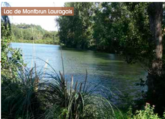
Lac de Montbrun Lauragais